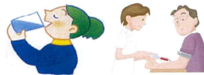
ブドウ糖液を飲む 採血