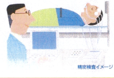
精密検査イメージ