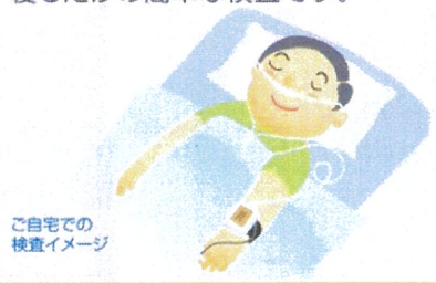
ご自宅での 検査イメージ