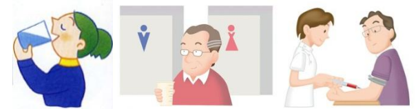
ブドウ糖液を飲む

30分後・1時間後・2時間後・3時間後の計5回(場合によっては、3時間後を省いて計4回)の採血および採尿(2回)を行います。